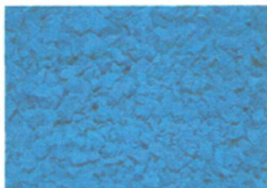
Ral: capri blue 5019