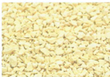
Ral: lemon yellow 1012