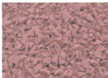
Ral: red 3016