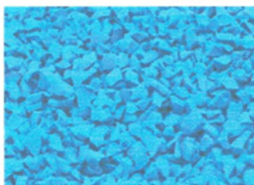
Ral: sky blue 5015

Kolorystyka istniejącego placu zabaw – kolory do odtworzenia